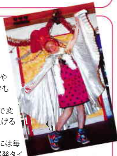
▲すでに人格まで別人です。