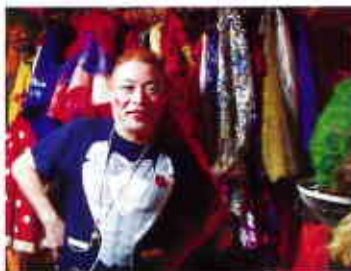
▲様々な衣装がズラリ!

大学時代はスキー部で大活躍、スキー指導も経験しました。スキーも凄いのですが、アフターの宴会部長として特に人気があったそうです。