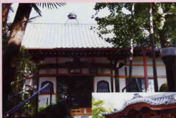
▲屋根に右釜が「通称「釜寺」