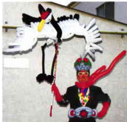
▲どんなものでもバルーンテクニックを駆使して作ってしまいます。