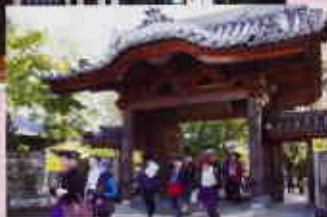
▲威風堂堂(大圓寺山門)