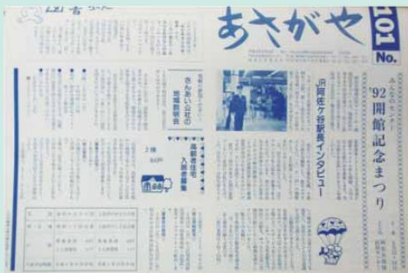
協議会報第101号(「あさがや」に改称) 平成4年4月発行