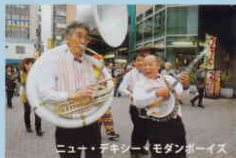
ニュー・デキシー★モダンボーイズ